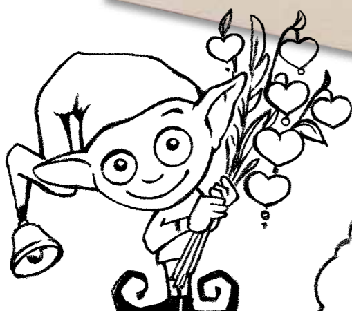
M-378421 · 12,50 Euro