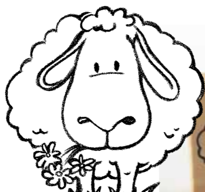
K-366424 · 11,25 Euro