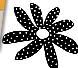
H-07155316 · 9,00 Euro